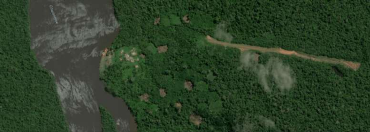
Aldea y pista de aterrizaje de Amatopo. El río Courantyne es la frontera entre Guyana (izquierda) y Surinam (derecha).

Dos días después de que Samuels fuera interceptado por el KPS, fue arrestado. Una unidad canina olfateó su avión y su camioneta, y una reacción positiva sugirió que había transportado cocaína. Sin embargo, tres semanas más tarde el juez archivó el caso por falta de pruebas. El resultado de una investigación interna de la policía sobre los agentes que presuntamente intentaron robar la cocaína no se ha hecho público.