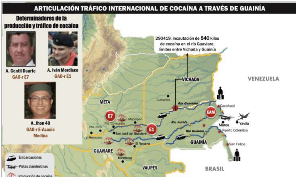
Fragmento de un informe reservado de la policía en el que se señala el tráfico de cocaína de las ex-FARC mafia hacia Surinam.

Aunque los correos hackeados describen una dinámica de 2016, el tráfico aéreo de cocaína desde la región fronteriza de Colombia y Venezuela hasta Surinam continúa hasta hoy. En agosto de 2023, el presidente de Surinam, Chandrikapersad Santokhi, declaró a la emisora de radio ABC que las narcoavionetas siguen aterrizando a diario en el interior del país